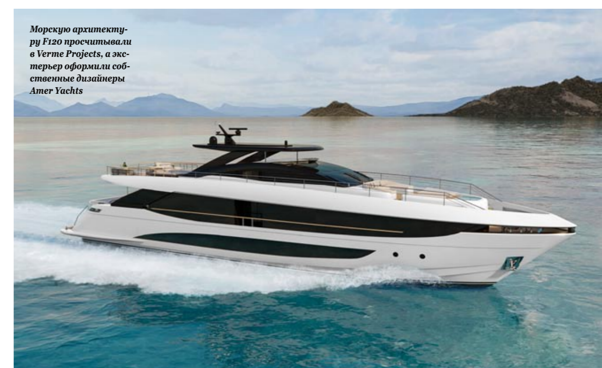
Морскую архитектуру F120 просчитывали в Verme Projects, а экстерьер оформили собственные дизайнеры Amer Yachts

F 120 БУДЕТ ОТЛИЧАТЬСЯ И БОЛЕЕ ШИРОКОЙ НАДСТРОЙКОЙ, ЧТО ПОЗВОЛИТ МАКСИМАЛЬНО УВЕЛИЧИТЬ ПЛОЩАДЬ САЛОНА, МАСТЕРА, КАМБУЗА И ДРУГИХ ВАЖНЫХ ПРОСТРАНСТВ