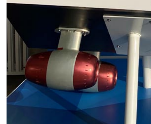
Электрические водометы DeepSpeed